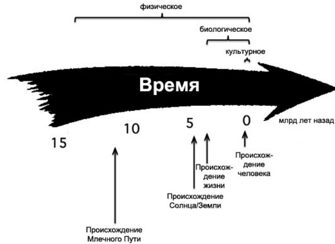
Рис. 1. Космическая эволюция

освободиться от антропоцентрического убеждения, что люди отличаются от других форм жизни на нашей планете, то космическая эволюция распространяет эту интеллектуальную революцию дальше, рассматривая материю на Земле и в наших телах наравне с материей далеких звезд и галактик.