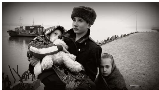
Историческая реконструкция событий Сталинградской битвы