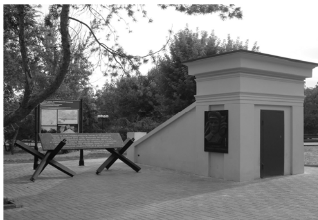
Фото 5. Вход в бункер СГКО. Мемориальная доска с барельефом А. С. Чуянова. Лето 2014 г.

В городском саду недалеко от этого убежища под землей размещался штаб Сталинградского городского комитета обороны (СГКО), где также пряталось множество гражданских людей.