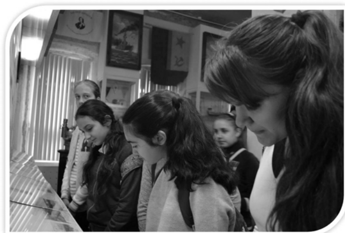
Ребята изучают документы музея МОУ ДОД «Детский морской центр имени Н. А. Вилкова» г. Волгограда