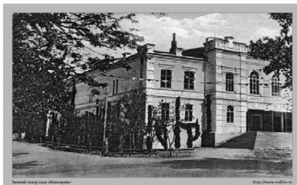
Фото 1. Здание театра «Конкордия» в долине реки Царица

В дневнике первого секретаря Сталинградского обкома ВКП(б) А. С. Чуянова в записи от 15 августа говорится: «Построено бомбогазоубежище на берегу р. Царицы» [Чуянов 1979: 130].