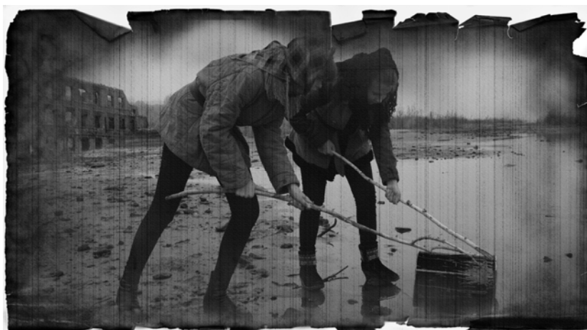
«Бакенщицы». Историческая реконструкция событий Сталинградской битвы