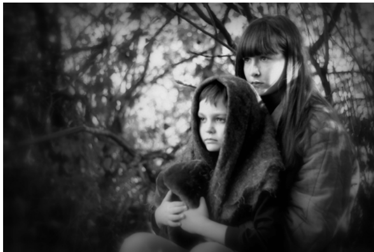
Историческая фотореконструкция «Женщины-матери в годы войны»