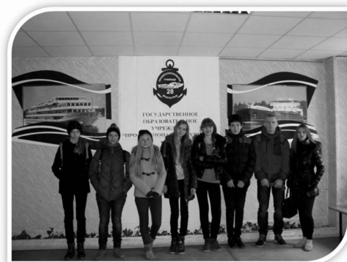
Ребята посетили ГОУ НПО «Профессиональное училище № 28 имени адмирала флота Н. Д. Сергеева» г. Волгограда, пообщались с курсантами и преподавателями, изучили документы