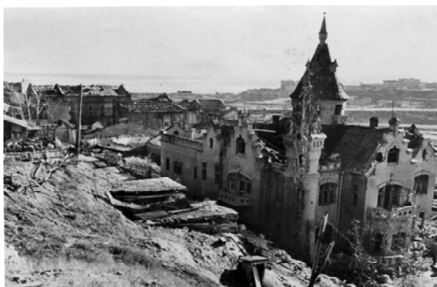
Фото 4. Дом Миллера после окончания Сталинградской битвы. На переднем плане, возможно, один из входов в массовое газобомбоубежище, разделенный на две части