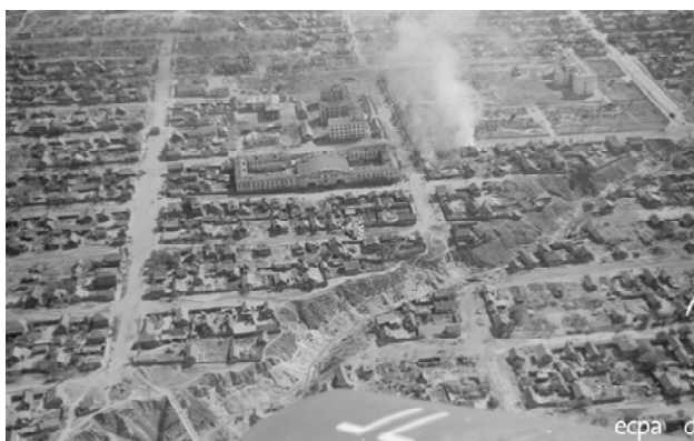
Фото 2. Немецкая аэрофотосъемка во время бомбардировки Сталинграда эскадрой пикирующих бомбардировщиков STG2 «Иммельман» в августе 1942 г. Свято-Духов монастырь (в центре). Выше монастыря здание 3-го Дома Советов.