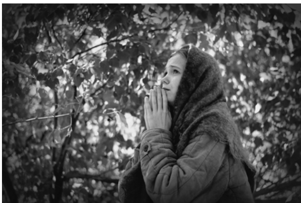
Историческая фотореконструкция «Женщины-матери в годы войны»