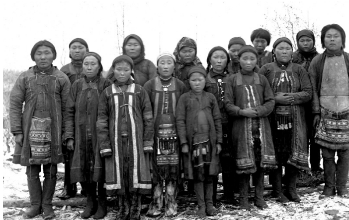
Рис. 2. Юкагиры. Фотография конца XIX века

Ясачные юкагиры (см. рис. 2) были основными помощниками русских не только как поставщики пищи, одежды, они служили проводниками, переводчиками, посредниками в русско-туземной торговле.