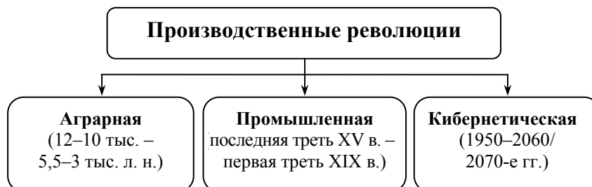
Рис. 1. Производственные революции в истории

Смена принципов производства связана с началом и совершением производственных революций 1 . Речь идет об: 1) аграрной революции; 2) промышленной революции; 3) кибернетической революции (см. Рис. 1).