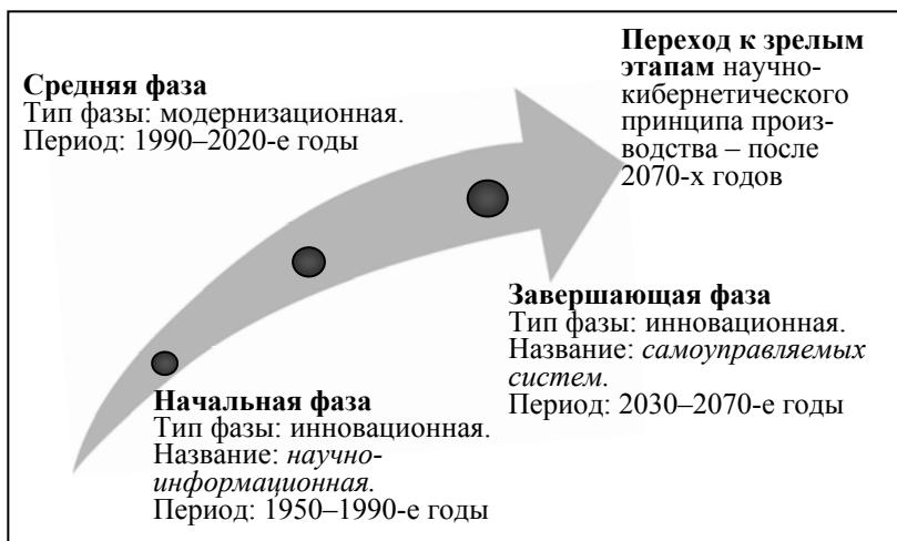
Рис. 3. Фазы кибернетической революции

Каждая из производственных революций означает переход к принципиально новой системе производства, начало каждой из них маркирует границы между соответствующими принципами производства.