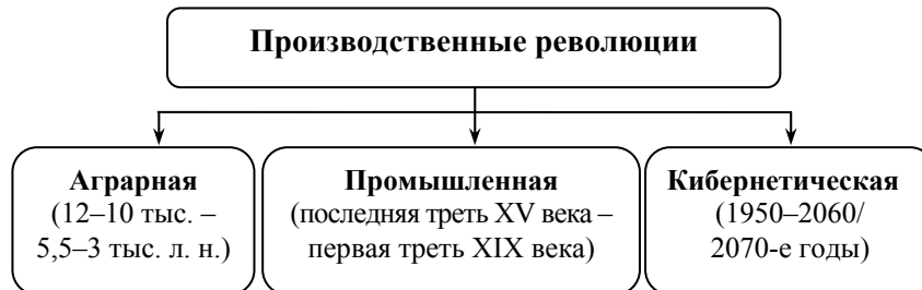
Рис. 1. Производственные революции в истории

3. Кибернетическая , на начальной фазе которой появились мощные информационные технологии, стали использоваться новые материалы и виды энергии, распространилась автоматизация, а на завершающей – произойдет переход к широкому использованию самоуправляемых систем (см. ниже).