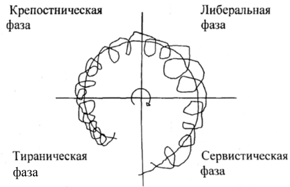
Рис. Коперникианская парадигма истории

Поэтому главным в четырех формах обмена является то, что они в основном подтверждают обоснованность выводов К. Маркса об «общественно-экономических формациях», которые во многом правильно отделяют одни исторические периоды от других. Кроме того, они убеждают, что на межличностном (дифференциальном) уровне социальная энергетика проявляет себя в виде тех или иных форм обмена ресурсами, тогда как на интегральном (общесоциальном) уровне она проявляет себя в виде взаимодействия противоположных и ортогональных классов. Становится, наконец, понятным, что основное содержание классовой борьбы сводится не к борьбе противоположных классов, в рамках той или иной общественно-экономической формации, как считали, например, К. Маркс и многие другие мыслители, а к борьбе ортогональных классов, определяющих движение общества от менее высокой ступени развития к более высокой.