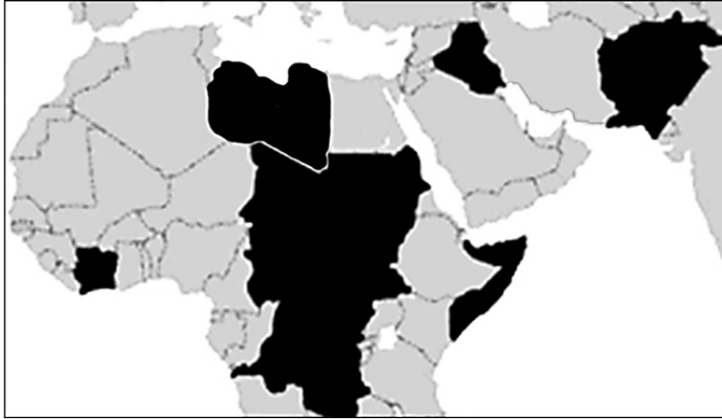
Рис. 2. Карта недееспособных государств (failed states)

Неудивительно, что в рейтингах недееспособности государств мира африканские страны стабильно занимают первые места (Fragile... 2015) (Рис. 2). Условия для системного кризиса могут сложиться, когда уровень техники и технологии (особенно военной) намного превышает уровень государственности. Это еще одна из причин формирования слабых или недееспособных государств.