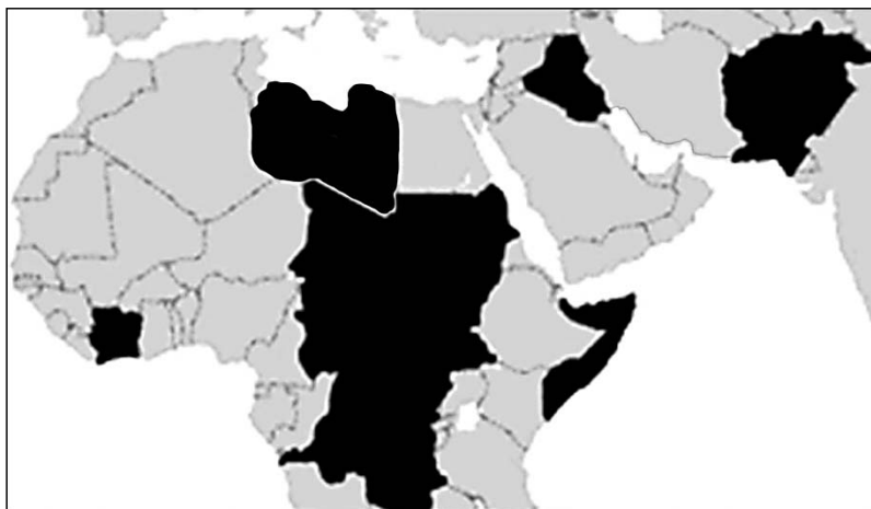
Рис. 2. Карта недееспособных государств (failed states)

сударственности. Это еще одна из причин формирования слабых или недееспособных государств.