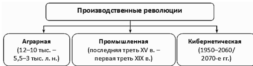
Рис. 1. Производственные революции в истории

Каждая производственная революция включает в себя три фазы: две инновационные (начальную и завершающую) и одну среднюю, располагающуюся между инновационными, – модернизационную (см. Рис. 2).