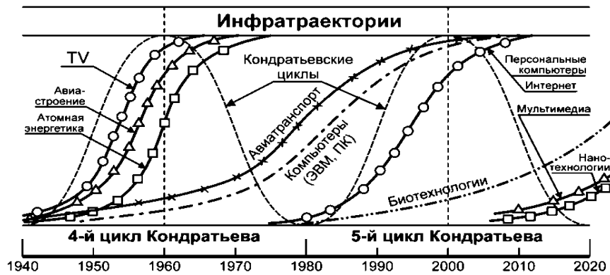
Рис. 1. Диффузия инноваций вдоль подъемов циклов экономической активности Кондратьева