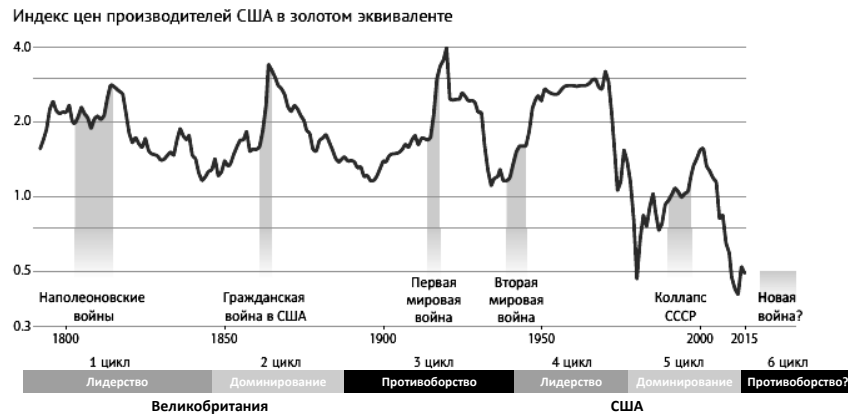
Рис. 3. Динамика цен производителей США в золотом эквиваленте (относительных единиц), отражающая динамику долгосрочных экономических циклов

Рисунок 3, отображающий все циклы Кондратьева, позволяет увидеть следующую закономерность. Первый цикл Кондратьева ознаменовался экономическим подъемом Великобритании, которая после Наполеоновских войн 2 , осуществив промышленную революцию на основе паровых двигателей, стала безусловным лидером и «мастерской мира». Во втором цикле Кондратьева Великобритания достигла политического могущества, стала диктовать свою волю всему миру, превратилась из лидера в доминанта, контролировала мировые финансы (фунт стерлингов стал, по существу, мировой валютой), обладала сильнейшей армией. Но одновременно «мастерская мира» стала перемещаться в такие быстроразвивающиеся страны, как США, Германия, Россия; экономическая дистанция между ними и Великобританией стала сокращаться. В третьем цикле Кондратьева стало очевидно снижение экономических возможностей и международного влияния Великобритании, которая в ответ стала пытаться затормозить развитие своих конку-