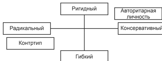
Рис. 2. Схема Айзенка с включенным в нее контртипом Йенша

Идея заключалась в том, что Адорно и Френкель-Брунsvик создали собирательный образ консерватора, а Йенш составил собирательный образ либерала (при этом будучи первым психологом, исследовавшим связь личности и политики), тем самым они могут находиться в одной объяснительной схеме. Тем не менее Айзенк отметил, что экспериментальная основа Йенша слабая (Айзенк Г., Айзенк М. 2001), и в этом автор данной статьи должен согласиться с мнением именитого психолога. Действительно, Йенш экстраполирует результаты экспериментов на восприятие различных форм и модальностей, перенося их на культурную и политическую жизнь личности, при этом не проводя прямых исследований на поведение I- и S-типов во время голосования, выборов, дебатов и т. д., в отличие, например, от того же Г. Айзенка и его ученицы Т. Коултер (Eysenck, Coulter 1972). Йенш изначально вводит допущение, при котором восприятие – это первый этап всей личности, и через него можно провести линию к чему угодно; удовлетворительность его экспериментов зависит от того, принимаете вы эту изначальную посылку или отвергаете.